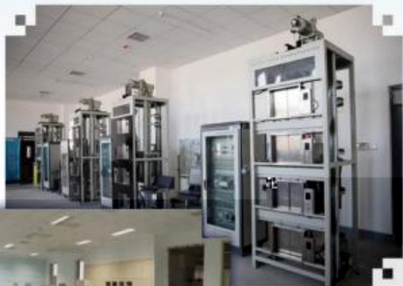
智能电梯安装调试 维护训练场所